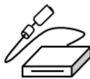
ICカードリーダライタ